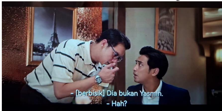
Gambar 3 Scene Identitas Asli Tokoh Utama Terbongkar