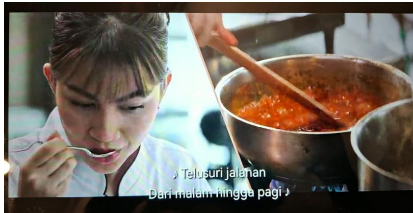
Gambar 5 Scene Perjuangan Karier