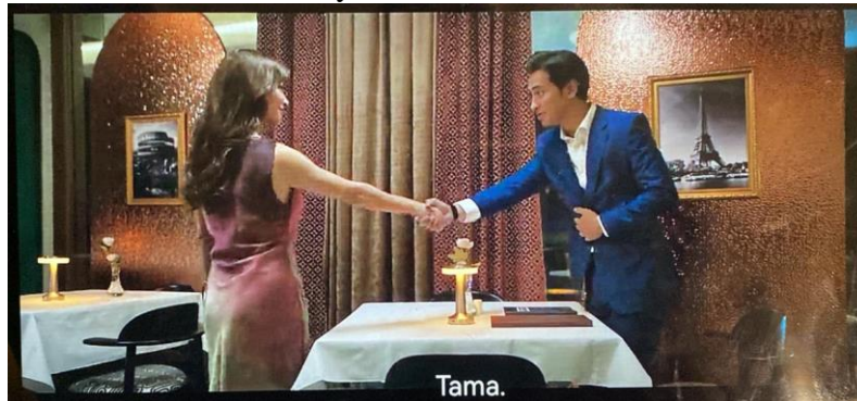
Gambar 1 Scene Penyamaran Saat Blind Date