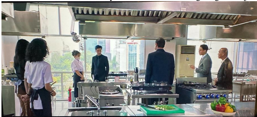
Scene Interaksi antara Karyawan dan CEO di Lingkungan Kerja

(Sumber: Film A Business Proposal , Time Code: 00:48:19)