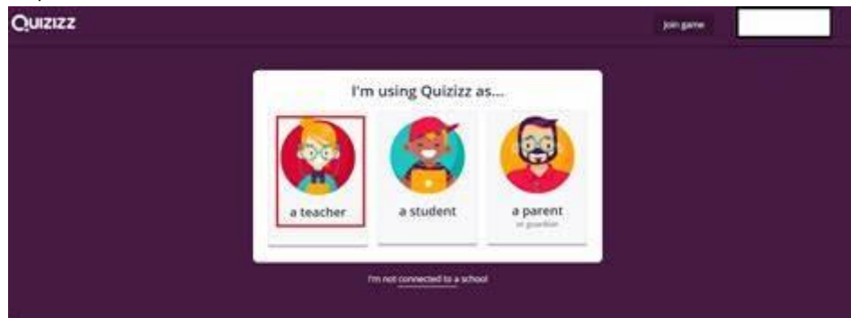
Gambar 3. Website Quizizz

dengan suara keras atau dalam hati. (Fikri, 2022). Maharah qiraah dibagi menjadi dua yaitu maharah jahriyyah (membaca keras), dan maharah shamitah (membaca dalam hati). Keterampilan membaca mempengaruhi pada struktur kata nahwu dan sharf (Nurcholis, 2019). Kegunaan media pembelajaran Maharah qira'ah adalah sebagai berikut: Melalui website Quizizz dapat menyediakan alat untuk menyesuaikan instruksi untuk memberikan pertanyaan atau pelajaran berdasarkan kebutuhan siswa. Situs ini sangat menarik karena siswa dapat mengakses materi atau soal yang disajikan dari ponselnya. Kode akses tentunya disediakan oleh dosen. Berbagai pilihan untuk memberikan umpan balik kepada siswa, seperti: pilihan ganda, kotak centang, isian bagian yang kosong, dan pertanyaan (voting). Situs ini juga dapat menyediakan alat untuk menambahkan video, gambar, atau audio ke pertanyaan atau kiriman. (Rosy, 2020)