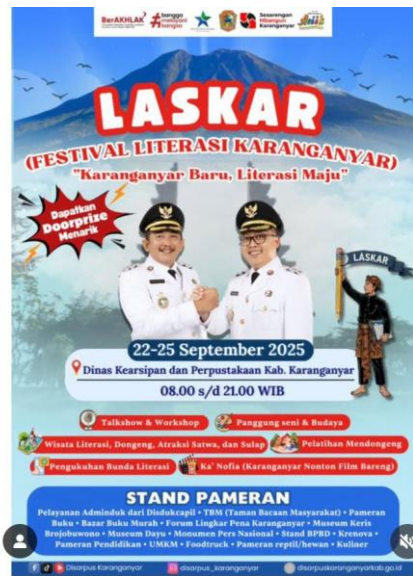
Gambar 1 Pamflet Festival Literasi Karanganyar

Gambar 1 adalah pamflet yang disebarluaskan baik di sosial media maupun disebarluaskan secara manual dengan dipasang dijalan jalan raya pada lokasi yang strategis yang mudah dibaca banyak orang. Penyebarluasan pamflet tersebut diharapkan agar masyarakat cepat mendapatkan informasi dan diharapkan dapat meningkatkan jumlah pengunjung yang akan datang di Dinas Kearsipan dan Perpustakaan Karanganyar.