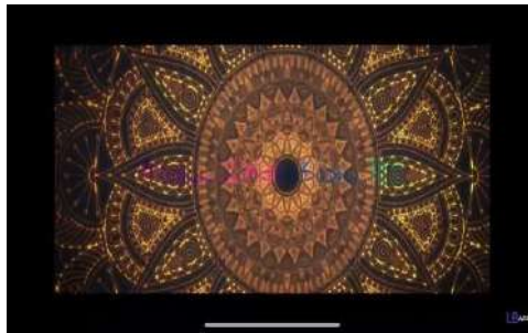
Gambar 1. Motif Batik

Berdasarkan pengamatan yang dilakukan, peneliti menemukan 6 scene di dalam Ikan Djarum 76 Edisi Dirgahayu Indonesia yang menunjukkan Ciri khas budaya daerah yang kemudian 6 scene ini dimasukkan kedalam analisis semiotika roland barthes untuk menemukan makna denotasi, konotasi serta mitos agar mencapai tujuan dari penelitian ini yaitu analisis makna budaya dalam iklan Djarum 76 Edisi Dirgahayu Indonesia Berikut adalah penjabaran dari scene tersebut.