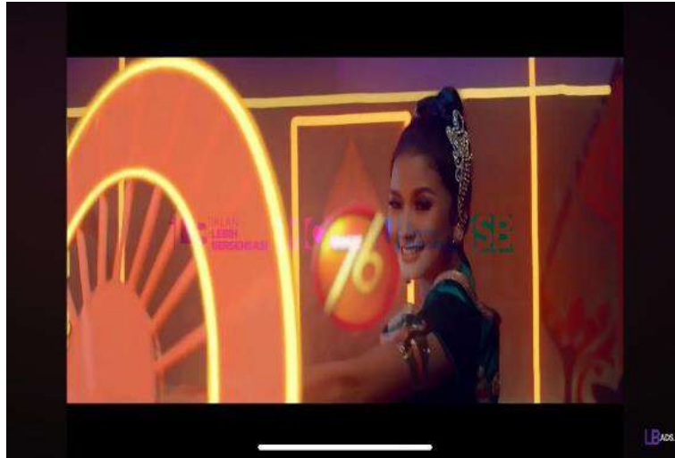
Gambar 4 Penari Payung Perempuan dengan Ekspresi Tersenyum