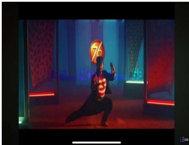
Gambar 3 Laki-laki Sedang Silat Madura