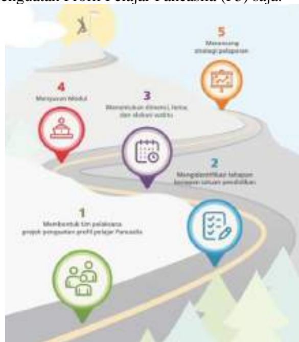
Gambar 1 Alur Proyek Penguatan Profil Pelajar Pancasila (P5)

Pelaksanaan kurikulum muatan lokal melalui muatan lokal dan Proyek Penguatan Profil Pelajar Pancasila (P5) memberikan kewenangan kepada satuan pendidikan, dalam hal ini adalah Sekolah Menengah Atas (SMA) untuk menentukan jenis maupun tema kegiatan yang akan dilaksanakan di sekolahnya masing-masing. Apabila muatan lokal maka terdapat sepuluh jenis, sehingga sekolah hanya cukup memilih satu saja, seperti seni atau prakarya. Sedangkan, pada Proyek Penguatan Profil Pelajar Pancasila (P5), sekolah memiliki kewenangan untuk menentukan dua sampai tiga tema. Namun, pelaksanaan kurikulum muatan lokal saat ini hanya dilakukan melalui Proyek Penguatan Profil Pelajar Pancasila (P5) saja.