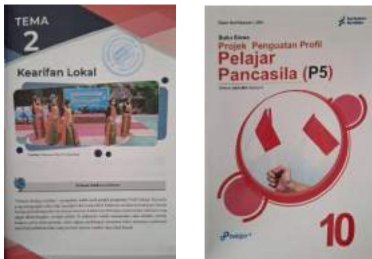
Gambar 3. Modul Pembelajaran Proyek Penguatan Profil Pelajar Pancasila

Oleh karena itu, penyediaan ruang kelas yang diawasi, proyektor, dan modul atau buku ajar merupakan penyediaan sumber daya dalam implementasi perubahan kurikulum lokal. Pembelajaran bahasa daerah dan Proyek Profil Pendidikan Pancasila (P5) harus dilaksanakan agar kurikulum dapat diselesaikan. Kurikulum sekolah seringkali memasukkan mata pelajaran senior, seperti praktik dan bisnis, dalam pembelajaran bahasa daerah. Namun, pendidikan sejarah lokal tidak dilaksanakan di sekolah karena belum ada peraturan daerah maupun peraturan gubernur yang mendukung pelaksanaannya di sekolah. Hal ini mulai terjadi pada tahun 2022 dan berlanjut hingga saat ini. Oleh karena itu, satu-satunya hal yang dilakukan sekolah adalah menerapkan Profil Pelajaran (P5). Meskipun pembelajaran lokal dapat diintegrasikan secara mulus dengan pembelajaran terkait budaya lokal di Sumatera Barat, Proyek Penguatan Profil Pelajar Pancasila (P5) berbeda karena sekolah diwajibkan untuk mencakup dua hingga tiga tema dari total empat puluh lima tema. Di sisi lain, fadom lokal merupakan salah satu topik yang dapat diajarkan bersamaan dengan pelajaran agama. Oleh karena itu, untuk kelas X dan XI, sekolah menggunakan tema pahlawan lokal. Sekolah memiliki buku pembelajaran untuk mendukung pelaksanaan tersebut.