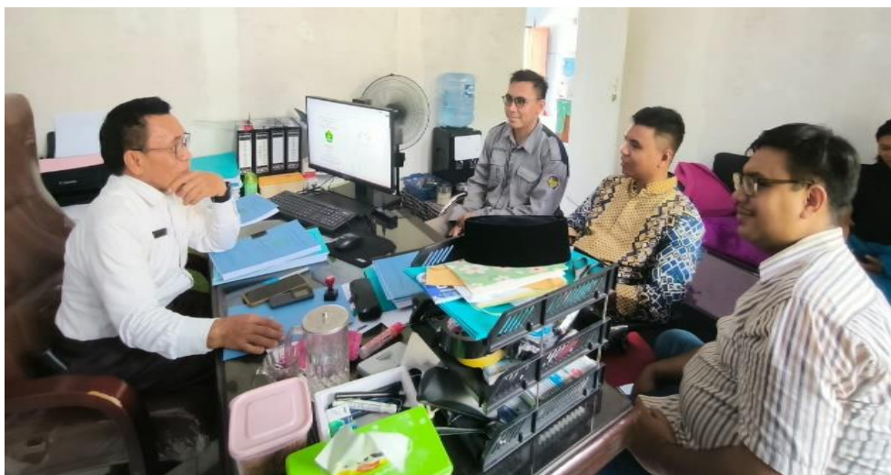
Gambar 1. Wawancara Dengan Kepala Sekolah

menyatakan bahwa mereka lebih suka belajar melalui pengalaman langsung dan praktik. Mereka merasa kurang tertarik pada teori yang diajarkan di kelas tanpa adanya aplikasi praktis yang menyertainya. Siswa menginginkan alat yang mudah digunakan, aman, dan mampu memberikan hasil yang jelas serta dapat diandalkan selama praktikum. Ketiga, analisis juga menunjukkan perlunya panduan yang jelas dan komprehensif dalam penggunaan alat. Siswa membutuhkan dukungan dalam bentuk instruksi yang mudah dipahami untuk mengoperasikan alat, termasuk langkah-langkah keselamatan yang harus diikuti selama percobaan.