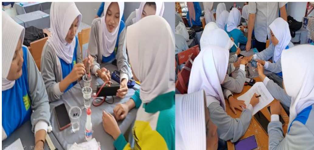
Gambar 2. Siswa Melakukan Pembelajaran Menggunakan Alat Praktikum

panduan praktis yang disediakan sangat membantu siswa dalam memahami langkah-langkah operasional dan prosedur keselamatan selama praktikum.