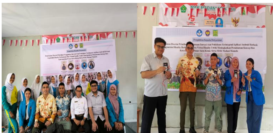
Gambar 3. Dokumentasi Kegiatan Pengabdian

Berdasarkan hasil praktikum, mayoritas siswa berhasil mengidentifikasi larutan elektrolit, seperti natrium klorida ( \text{NaCl} ), yang menunjukkan bahwa alat berfungsi dengan baik. Sebaliknya, larutan non-elektrolit seperti gula tidak menunjukkan adanya konduktivitas listrik, yang sesuai dengan teori yang diajarkan. Observasi ini memperkuat pemahaman siswa mengenai konsep elektrolit dan non-elektrolit dalam konteks praktis. Selain itu, dari umpan balik yang diperoleh setelah pelaksanaan praktikum, siswa menyatakan bahwa alat ini membuat pembelajaran kimia menjadi lebih menarik dan interaktif. Mereka merasa lebih percaya diri dalam melakukan eksperimen, yang dapat meningkatkan minat mereka terhadap mata pelajaran kimia. Dengan demikian, inovasi alat praktikum ini tidak hanya memenuhi kebutuhan pembelajaran, tetapi juga berkontribusi positif terhadap pengalaman belajar siswa. Dokumentasi kegiatan dapat dilihat pada Gambar 3.