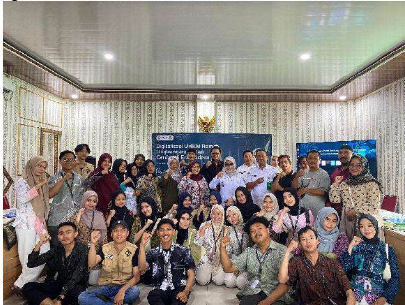
Gambar.2 Kegiatan Sosialisasi Digitalisasi UMKM

Kegiatan sosialisasi dilaksanakan sebagai tahap awal untuk memberikan pemahaman kepada para pelaku UMKM di desa mengenai pentingnya adopsi teknologi digital dalam pengelolaan usaha. Materi yang disampaikan meliputi pengertian digitalisasi, manfaat bagi peningkatan daya saing usaha, serta tren perilaku konsumen yang semakin mengandalkan platform digital untuk bertransaksi. Sosialisasi ini dilakukan di kantor Desa Sukatani pada hari Rabu, 13 Agustus 2025.