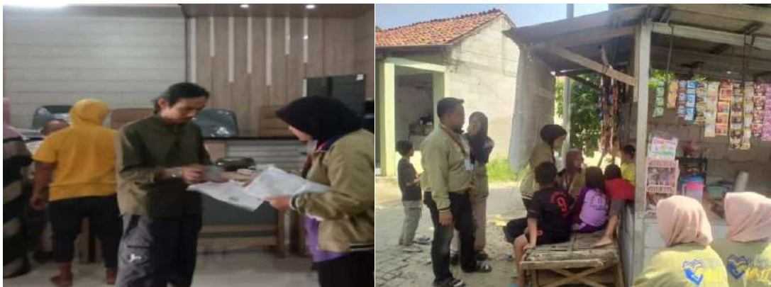
Gambar 3. Dokumentasi Proses Pendampingan kepada UMKM

Hasil kegiatan menunjukkan bahwa mayoritas pelaku UMKM sangat tertarik menggunakan QRIS karena praktis dan sesuai dengan tren cashless society. Beberapa peserta langsung mengaktifkan QRIS dan mulai menggunakannya pada saat kegiatan berlangsung.