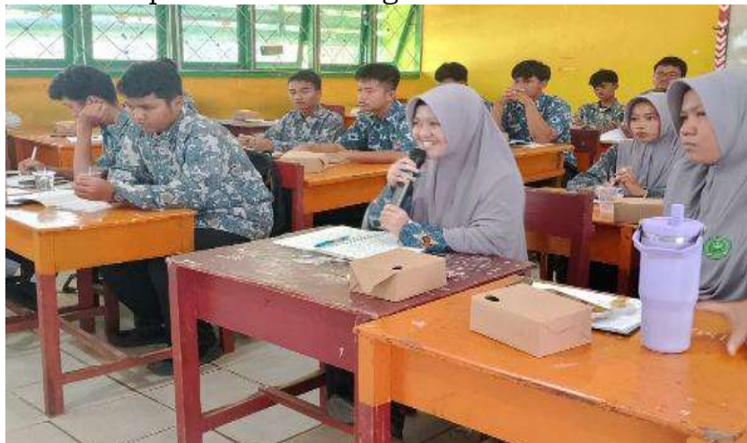
Gambar 4. Peserta didik aktif mengikuti kegiatan pelatihan (Tim PKM, 2025)

Selama pelatihan berlangsung, para peserta didik menunjukkan antusiasme yang tinggi dan turut berpartisipasi secara aktif dalam setiap sesi diskusi. Mereka mengajukan berbagai pertanyaan yang memperdalam pemahaman mereka mengenai cara menelusuri informasi tentang tokoh lokal serta langkah-langkah menyusun biografi yang baik. Antusiasme tersebut juga terlihat dari keinginan peserta didik untuk mengetahui lebih jauh tentang tokoh-tokoh inspiratif di Kabupaten Sanggau dan bagaimana nilai keteladanan para tokoh tersebut dapat mereka tuangkan dalam tulisan.