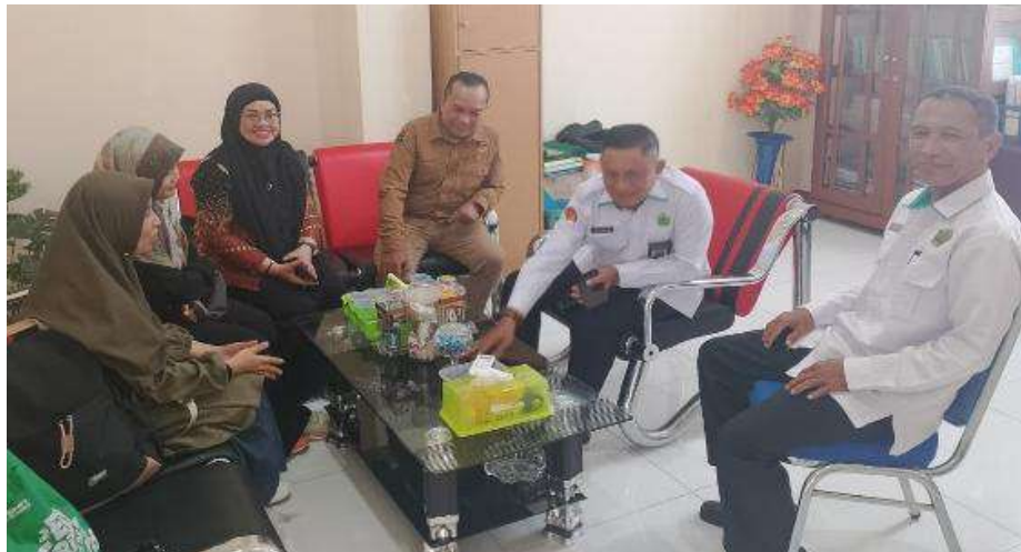
Gambar 1. Kordinasi bersama Kepala MAN Sanggau dan Kepala Kantor Kemenag Sanggau (Tim PKM, 2025)

Sebelum pelatihan dilaksanakan, Tim Pengabdian kepada Masyarakat (PKM) mengadakan tahap koordinasi dengan pihak MAN Sanggau. Kegiatan koordinasi ini bertujuan memetakan kebutuhan peserta didik, terutama terkait pemahaman mereka tentang sejarah lokal serta kemampuan menulis yang masih perlu ditingkatkan. Berdasarkan hasil diskusi tersebut, diketahui bahwa sebagian besar peserta didik belum mengenal tokoh-tokoh penting dalam sejarah Sanggau dan belum pernah mengikuti pelatihan khusus tentang penulisan biografi. Selain itu, minimnya kegiatan pembinaan literasi yang secara khusus mengangkat tokoh-tokoh lokal menunjukkan perlunya program yang dapat mengisi kekosongan tersebut. Oleh karena itu, pelatihan penulisan biografi tokoh lokal ini dipandang strategis sebagai sarana pengembangan keterampilan menulis, sekaligus sebagai kontribusi nyata dalam melestarikan sejarah dan budaya daerah melalui keterlibatan aktif peserta didik sebagai generasi penerus.